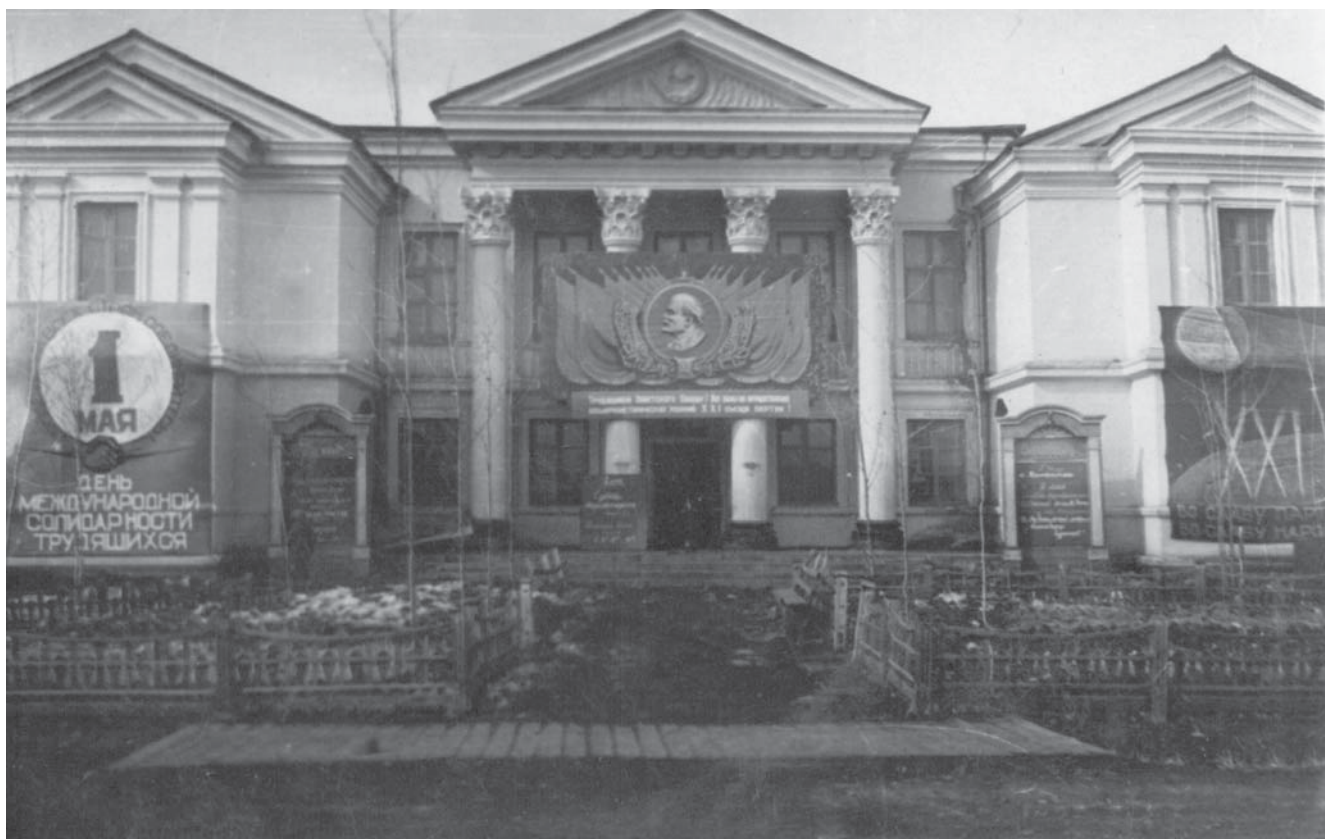
Среднеканский Дом культуры. Сеймчан. 1950-е