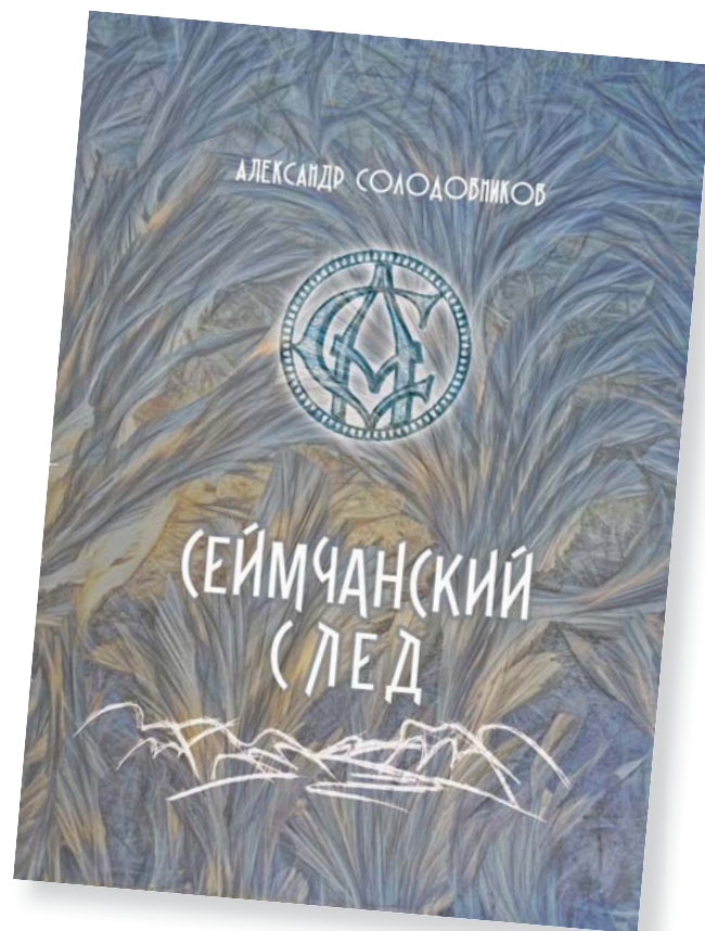
Обложка книги А. Солодовникова «Сеймчанский след»

Новое издание «Сеймчанский след» посвящено 125-летию со дня рождения Александра Солодовникова и 80-летию начала массовых политических репрессий в нашей стране в 1937 году. Его главную часть составляют разделы, построенные на материалах магаданского историка-краеведа С.В. Будниковой, пред-