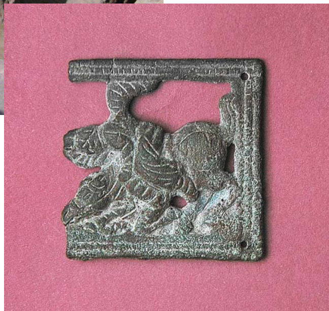
Поверженный всадник – сак или юечжи. Bronze buckle.

жается и в настоящее время. За эти годы была создана фундаментальная, по существу, уникальная база научных данных, которыми могут пользоваться ученые, занимающиеся эллинистической и кушанской археологией во всем многообразии ее проявления.