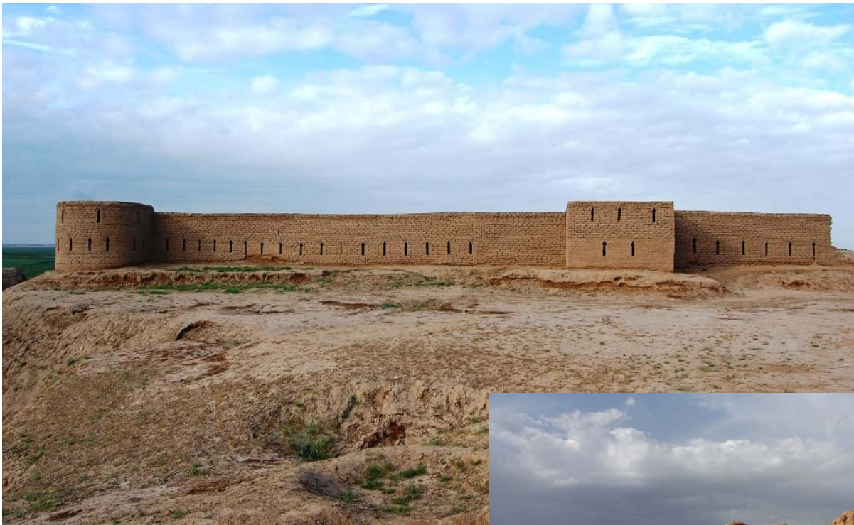
Городище Кампыртена.