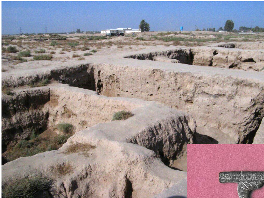
Городище Дальверзинтепа.

экономические, культурные и даже политические связи. Начиная с XIX века, на эту тему в разных странах появлялись статьи и материалы, но не было ни одной монографии. Я собрал огромное количество археологических данных, очень ценных письменных источников, свидетельств путешественников, множество различных карт и рисунков.