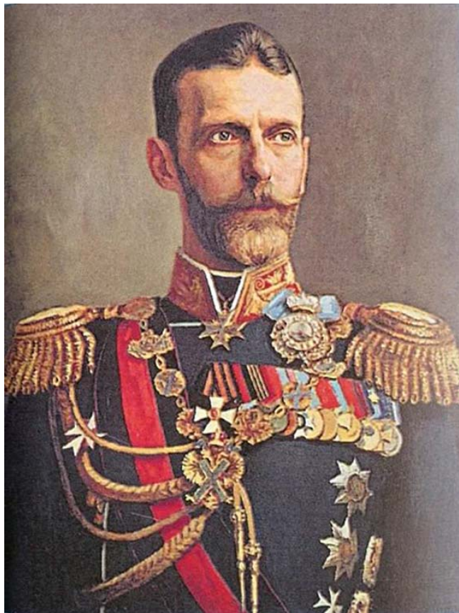
Великий Князь Сергей Александрович