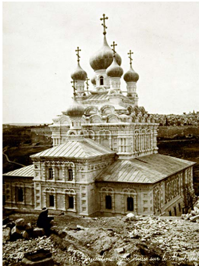
Храм во имя св. равноапостольной Марии Магдалины в Гетсимании (заложен 20 января 1885 г. освящен 1 октября 1888 г.). Фото 1888 г. ГМИИ

щества был высочайше утвержден 8 мая 1882г., а уже 21 мая на заседании в С.-Петербурге во дворце великого князя Николая Николаевича (Старшего), на котором присутствовали император Александр III, императрица Мария Федоровна и многие члены императорской семьи, представители русского и греческого духовенства, ученые и дипломаты, состоялось торжественное открытие Общества. В состав почетных членов вошли тринадцать членов царской семьи во главе с императором и императрицей, премьер-министр, министр иностранных дел, обер-прокурор Святейшего Синода.