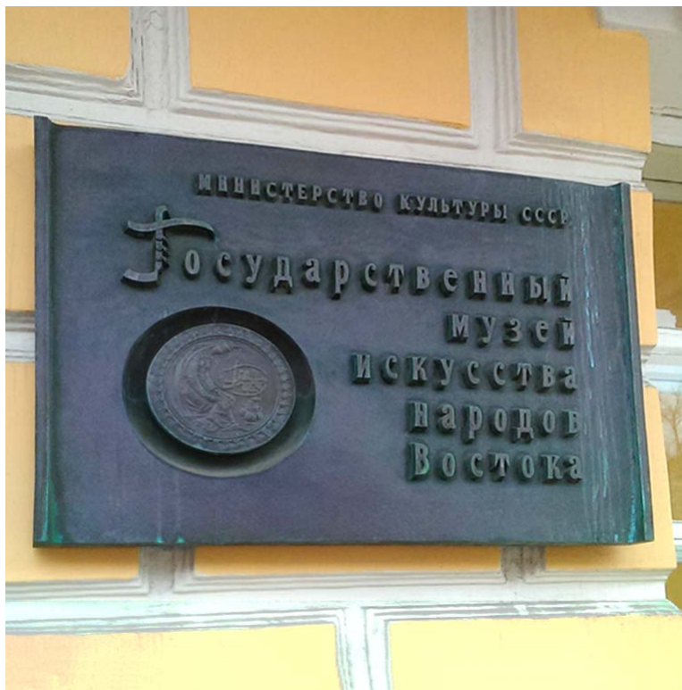
Штрих к истории музея — табличка с прежним названием