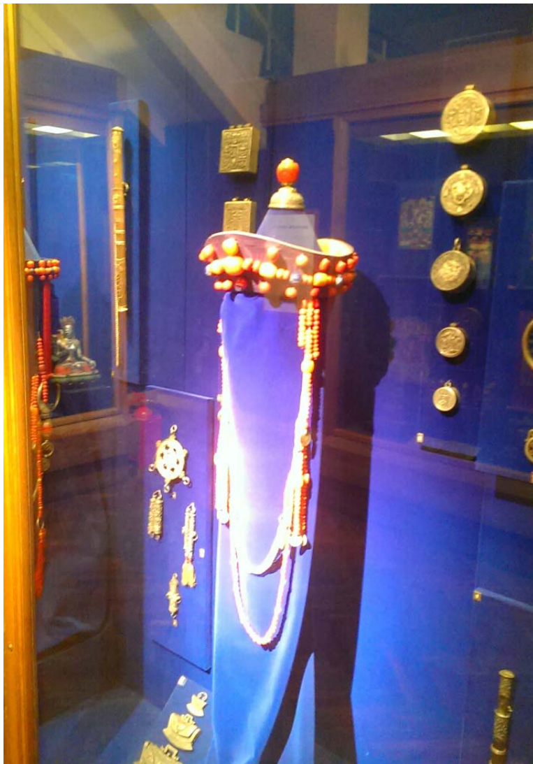
Фрагмент экспозиции, посвященной искусству Бурятии