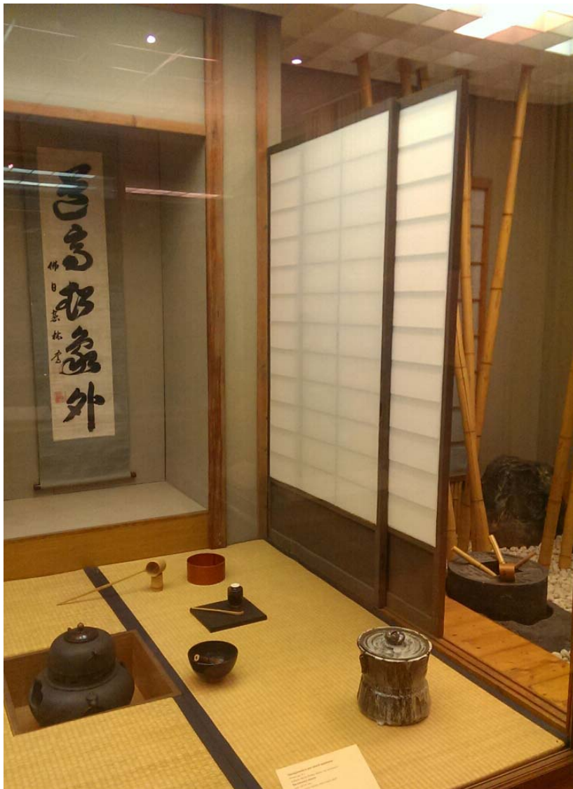
Чайная церемония. Фрагмент экспозиции. Япония. Середина XX в.

сказывающие об искусстве Советского Востока, Китая, Японии, Тибета, Ирана, Индии и Монголии, начали работать реставрационные мастерские. 1960–1970-е связаны с большим числом археологических и закупочных экспедиций, с развитием научно-исследовательской работы и культурных связей со странами Азии и Африки. Появилась постоянная экспозиция, посвященная наследию семьи Рерихов, а в 1979 году открыли Мемориальный кабинет Н.К. Рериха. В 1980-х состоялись новые археологические экспедиции на Северный Кавказ, Чукотку, в Среднюю Азию, а в Майкопе приступили к созданию Северо-Кавказского филиала музея. В 1987 году Государственный музей Востока получил статус научно-исследовательского учреждения первой категории, а в 1991 году