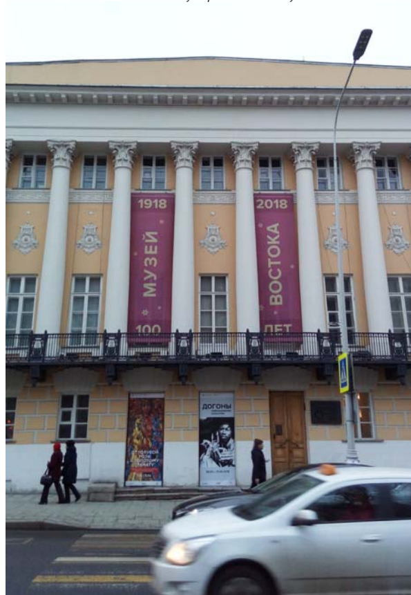
Государственный музей Востока

Но, пожалуй, среди наиболее крупных событий начала юбилейного года — выставка