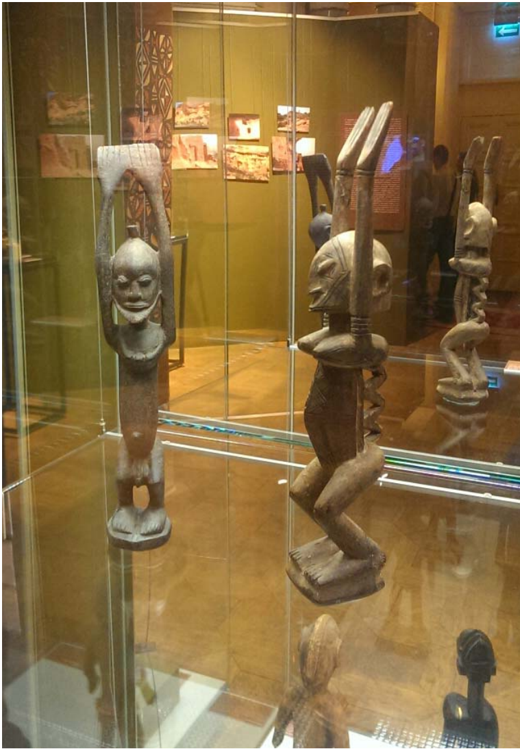
«Догоны. Небезымянное искусство». Предметы статуарной пластики