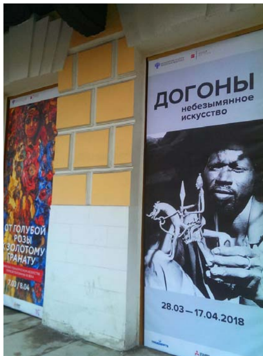
Выставочные проекты музея

«От голубой розы к золотому гранату. Образ Востока в русском искусстве». Согласно выставочной концепции, две метафоры в этом названии отражают неразрывность художественных связей России и Востока. Образ голубой розы более 100 лет назад подарил название выставке, а затем и творческому объединению художников-символистов, ядро