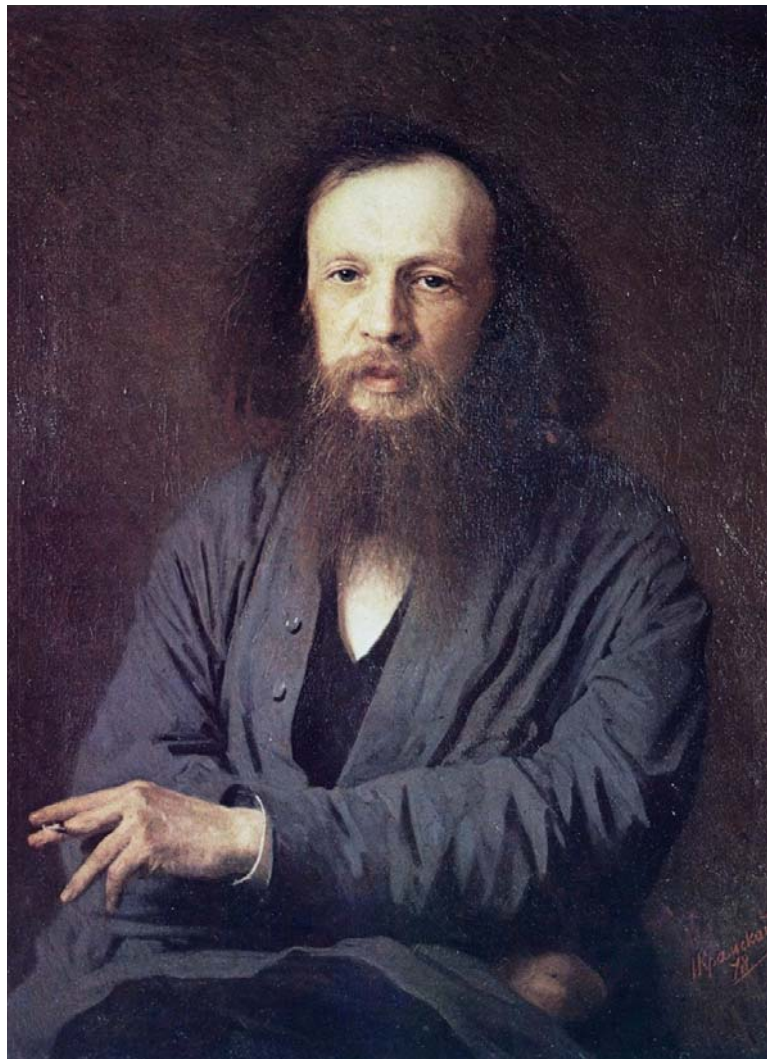
И.Н. Крамской. Д.И. Менделеев. 1878

так как все главнейшие научные академии, начиная с Лондонской, Римской, Парижской, Берлинской, Бостонской избрали меня своим сочленом, как и многие ученые общества России, Западной Европы и Америки». Еще при жизни гений получил свыше 130 дипломов и почетных званий от русских и зарубежных академий и других научных учреждений.