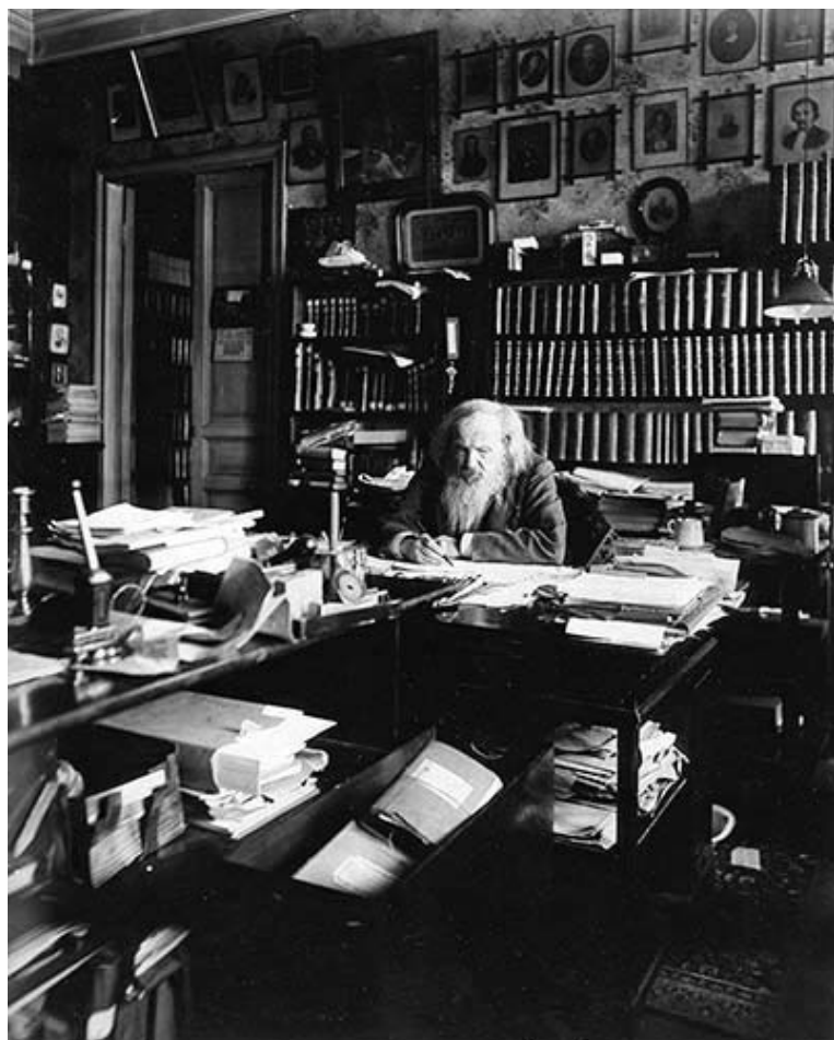
Д.И. Менделеев в кабинете, 1904

очень ошибаются, насильно надевая на нашего мужика западный кафтан, наши политические и экономические верхогляды не могут никак понять, что он на него не лезет или что наш мужик в нем беспомощно болтается». Ученый неоднократно подчеркивал, что «подражательство» и «идолопоклонство занятым идеям» обуславливают «отсутствие способности уловить действительные и простые нужды страны и народа и действовать в их интересах».