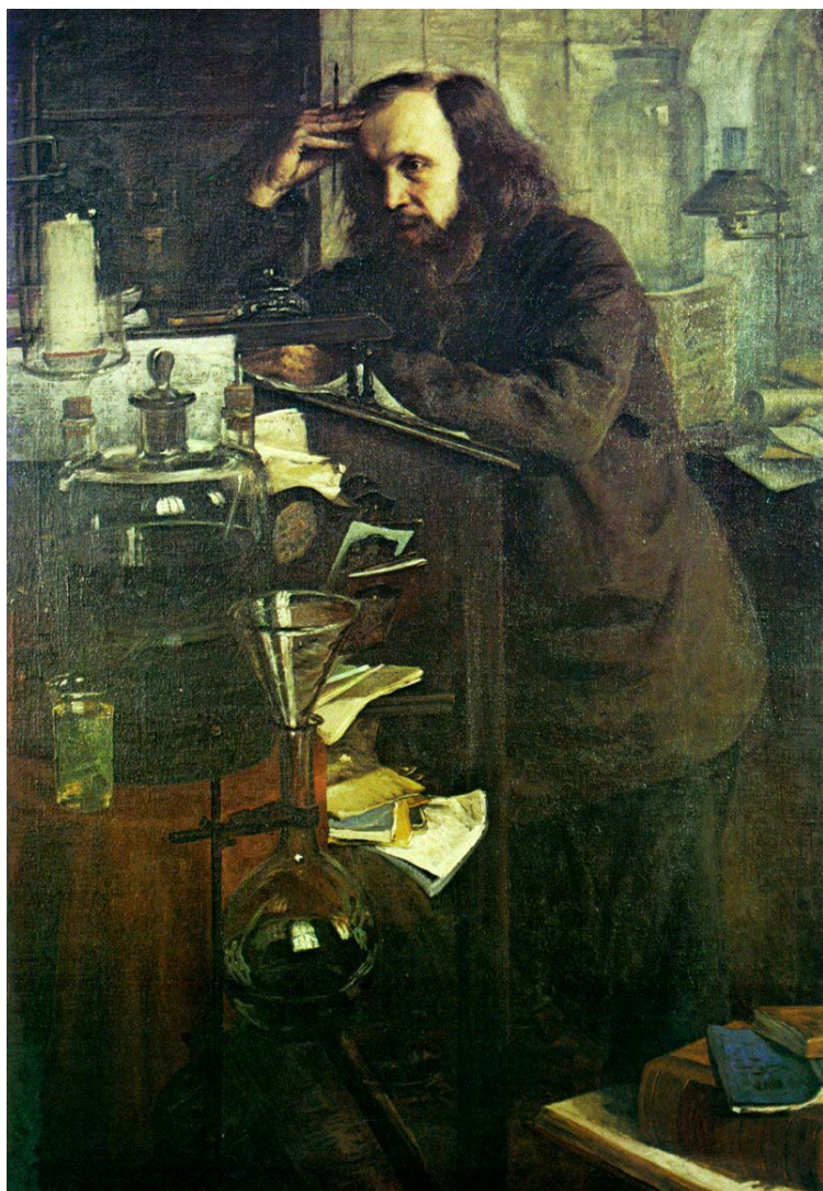
Н.А.Ярошенко. Портрет Дмитрия Менделеева.1886

вития России в эпоху императора Александра III и его сына Николая II.