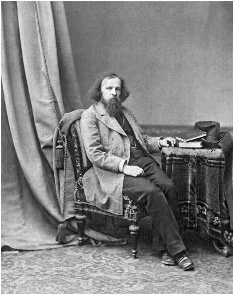
Дмитрий Иванович Менделеев

ченного для обеспечения как личностей, так и их взаимностей...» «Собственность для людей служила стимулом множества передовых личных действий; в земле же и языке складывается до грубости явно и необходимость определений собственности отдельных народов и стран».