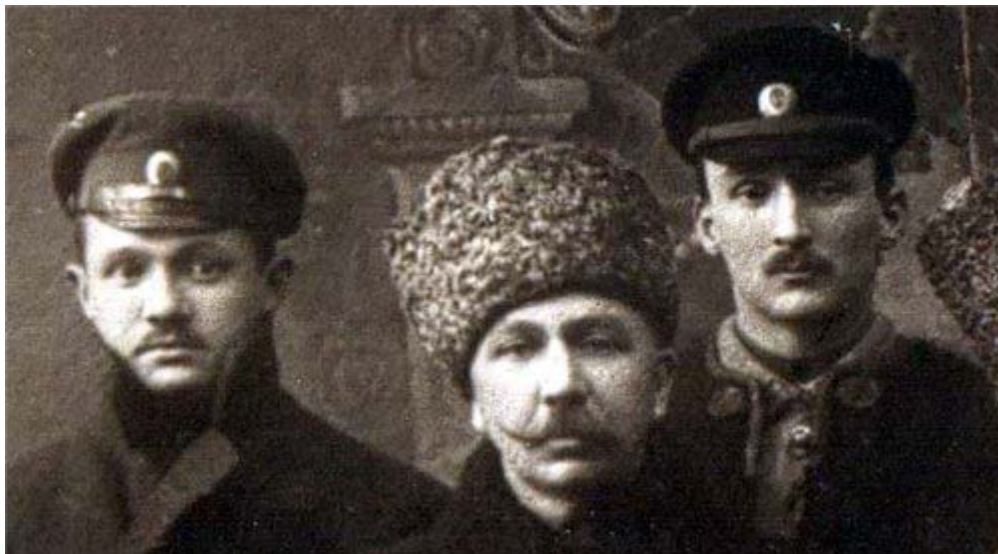
Петр Краснов перед Первой мировой войной

бой. Это предательство подчиненных более всего потрясло генерала. Он тогда чудом избежал расстрела.