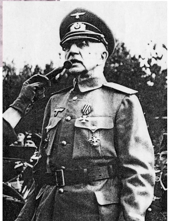
П. Краснов присягает Гитлеру

в Эстонию. И супруги Красновы 20 марта 1920 года в экспрессе «Ревель — Берлин» покинули Россию.