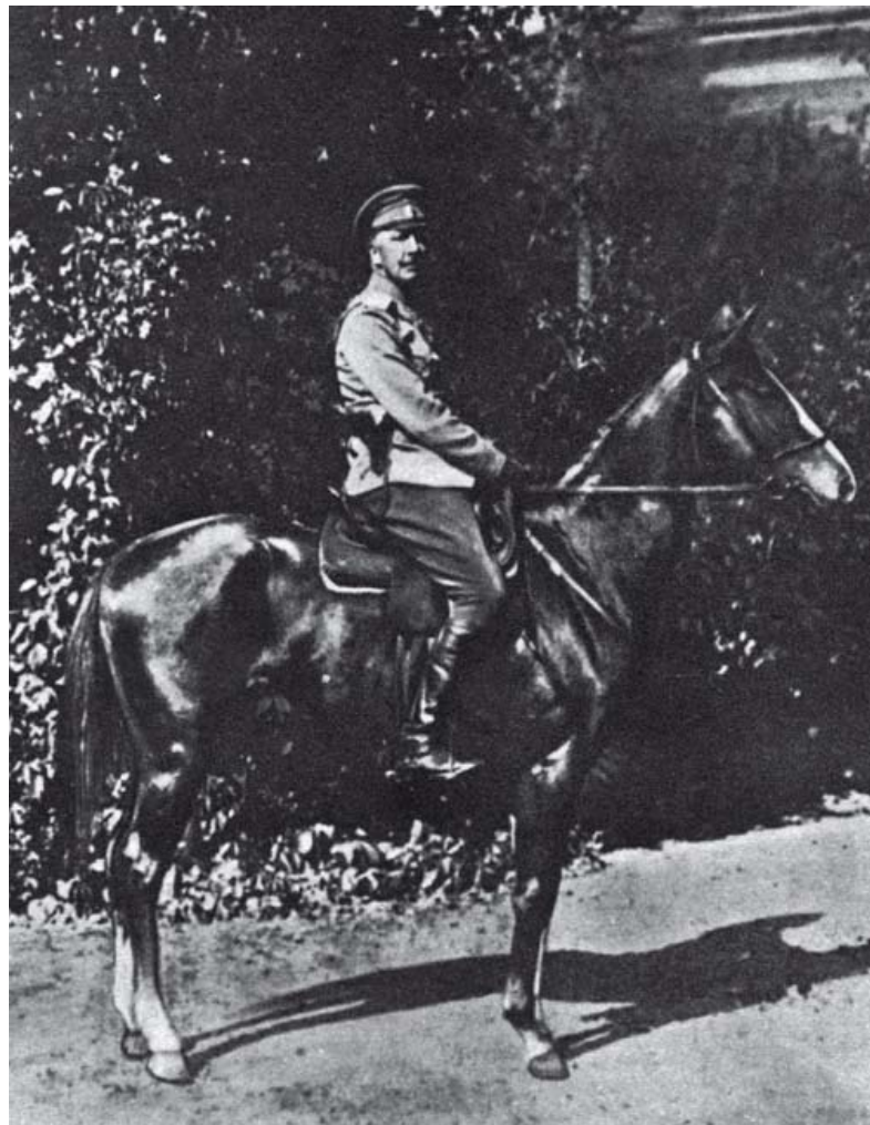
П.Н. Краснов перед Первой мировой войной