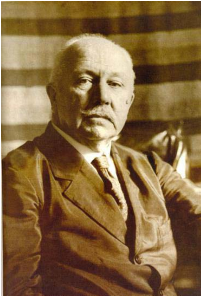
Петр Краснов в эмиграции. 1930-е