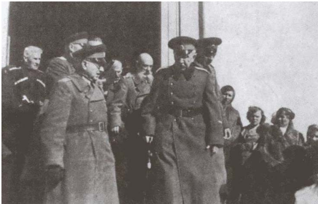
Генерал Петр Краснов (справа) и генерал Тимофей Доманов

военно-научная и литературная газета «Русский инвалид» (1813–1918): редакция тотчас привлекла офицера к постоянному сотрудничеству. Лейб-гвардеец в течение нескольких лет вел здесь рубрику «Вторник у генерала Бетрищева», вскоре ставшую в войсках очень популярной. Наверное, потому, что темы ее были самые животрепещущие — быт и моральный облик русского офицера, русские полководцы, проблемы коневодства и подготовки конницы как рода войск, конный спорт в армии... Эти публикации время от времени попадали даже на стол императора: прочитав, Николай II отправлял их со своими пометками военному министру.