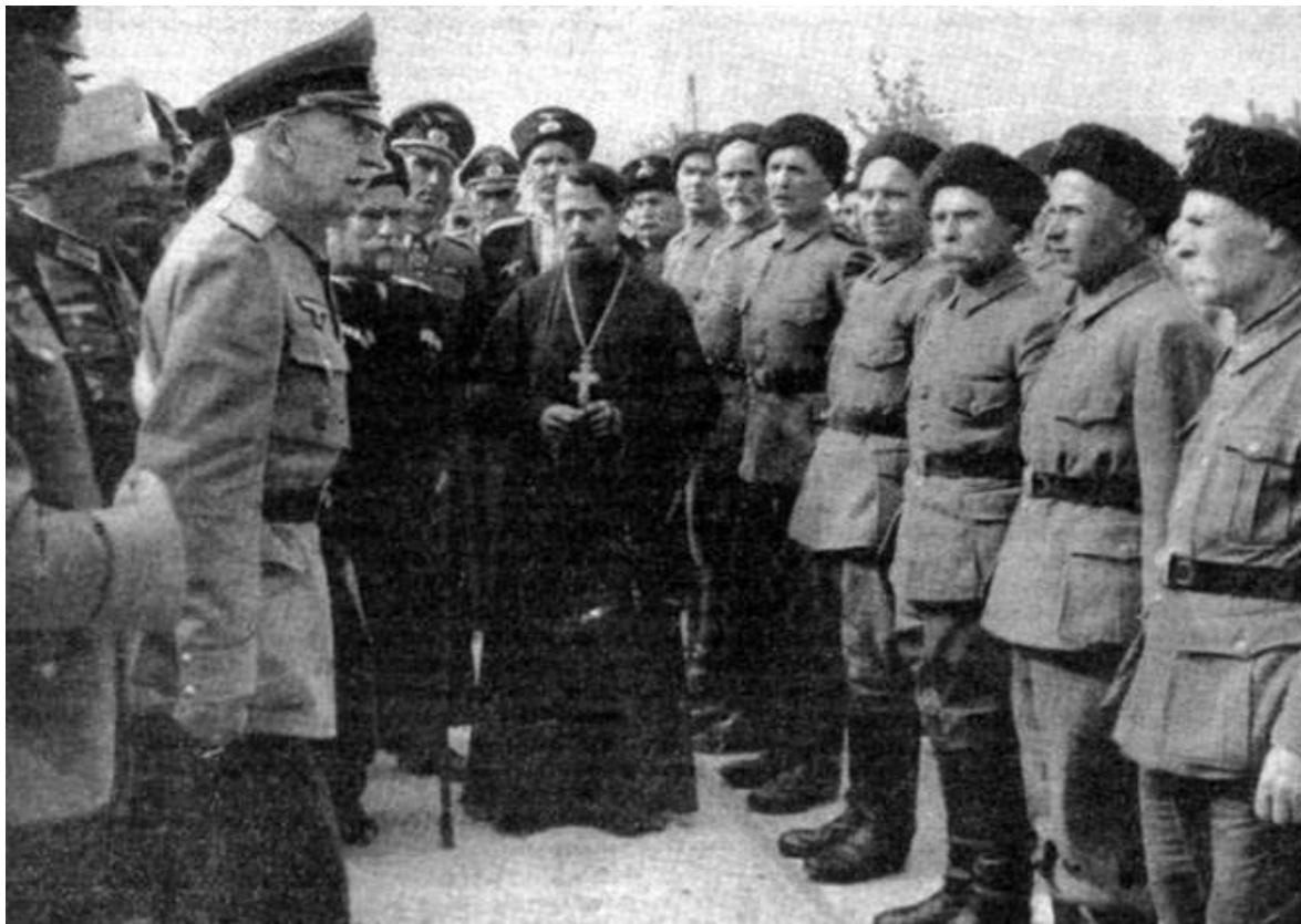
П. Краснов в нацистской форме инструктирует новобранцев

ва», в которой известный публицист дал оценку, какой была в тот период Добровольческая армия Деникина: «Доблести много, дисциплины мало!» Здесь тоже видится ответ на вопрос, почему Краснов после тяжких размышлений пошел своим путем, не соединил свои 60-тысячные казачьи войска с 12-тысячным добровольческим отрядом, жившим к тому же на содержании у донцов, которые снабжали деникинцев не только оружием, но и войсковым довольствием.