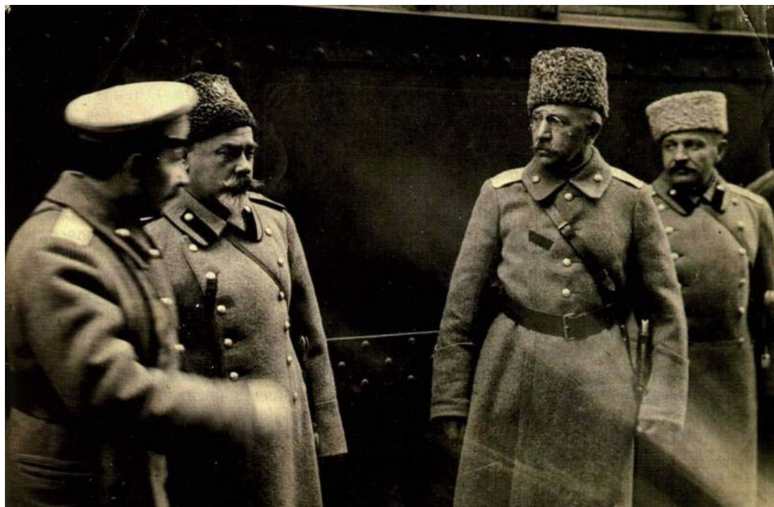
Командный состав Добровольческой армии. Генералы А.П. Богаевский, А.И. Деникин, П.Н. Краснов. Станция Чир. 1918