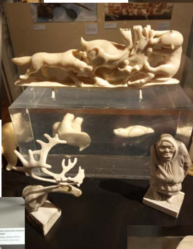
Произведения современных косторезов Чукотки