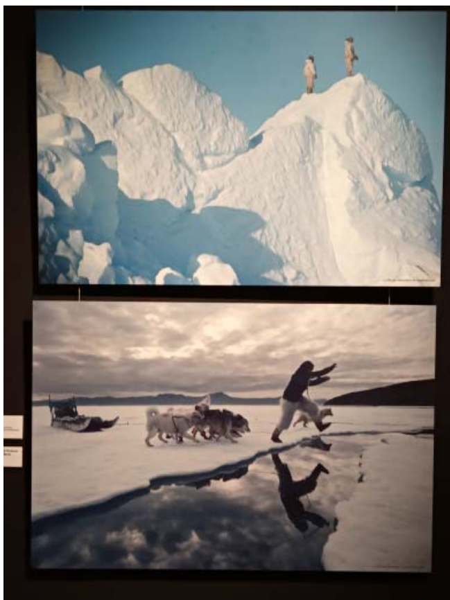
«Арктика: круги жизни». Фрагмент экспозиции