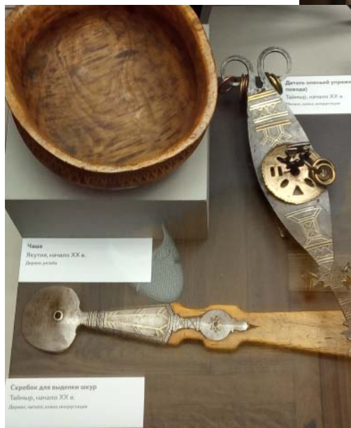
Предметы якутской традиционной культуры