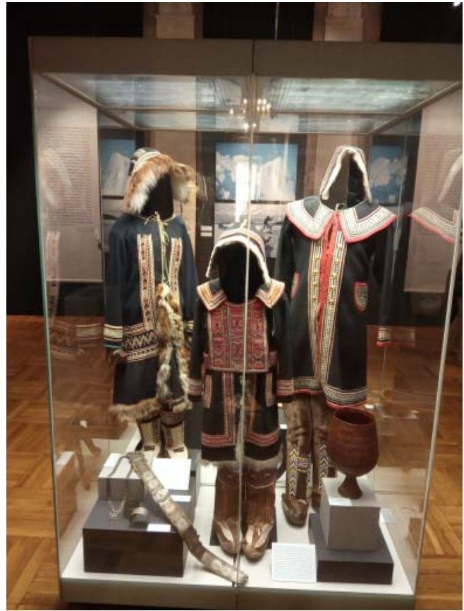
Традиционные костюмы якутов. Фрагмент экспозиции

зале, представила «арктические феномены» — особые оптические эффекты, в том числе и полярное сияние, возникающие при сверхнизких температурах. Фотографии Брайана Александра поражают внутренней динамикой: он «схватывает» редкие состояния природы и вписывает в этот величественный пейзаж живущих здесь людей. Каждый кадр — эмоциональный диалог человека с бескрайними снегами, искрящимся солнцем, нереально голубым небом.