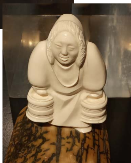
Произведения современных косторезных мастеров Чукотки