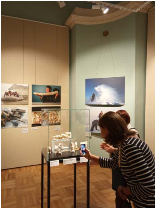
«Женщина с ведрами молока». Художник Ф. Марков (Якутия)