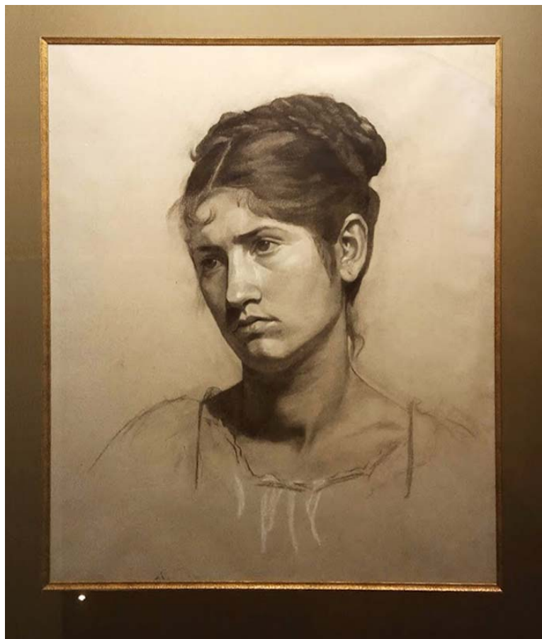
«Женский портрет». Частная коллекция. Фрагмент экспозиции.