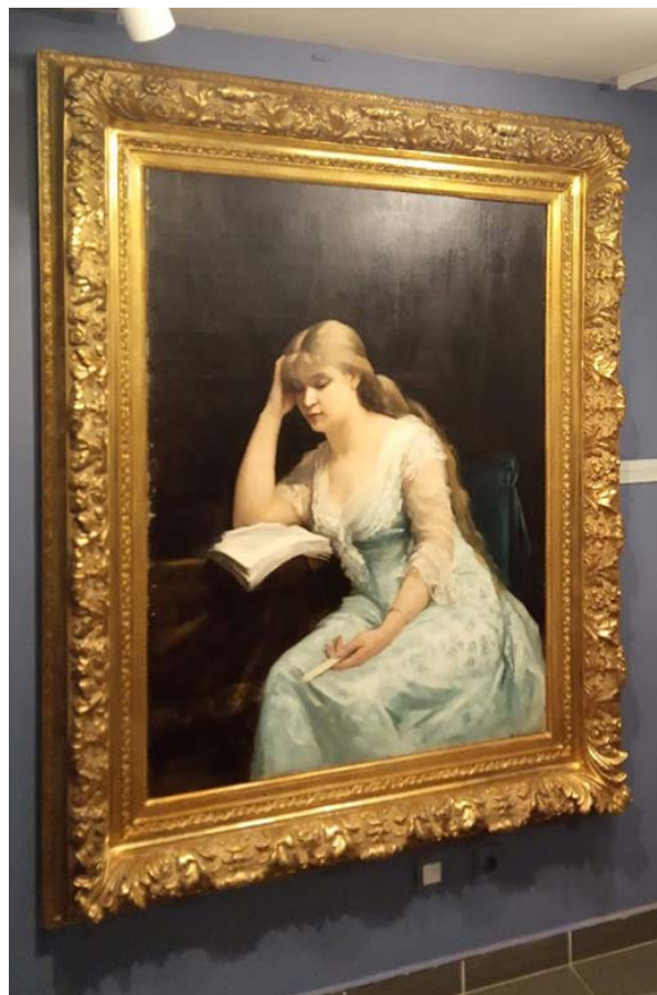
«Молодая женщина, читающая "К вопросу о разводе" А. Дюма». 1880. Холст, масло. Фрагмент экспозиции.

ческое наследие общедоступным. В 1930 году, когда из центральных собраний изымались произведения искусства и направлялись в небольшие музеи по всей стране, коллекция Башкирцевой потеряла целостность. Несколько картин передали в музеи Красноярска и Днепропетровска, а спустя два года на Украину отправили еще 127 работ. Во время Великой Отечественной войны эвакуировали Харьковскую картинную галерею, и 66