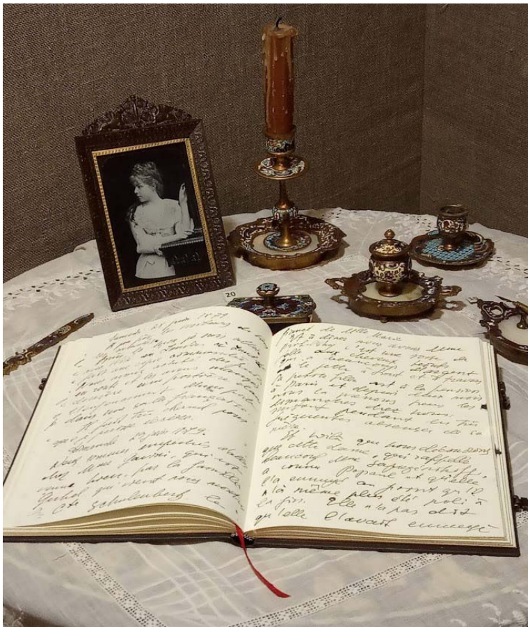
Личные вещи Марии Башкирцевой на выставке «Избранница судьбы».