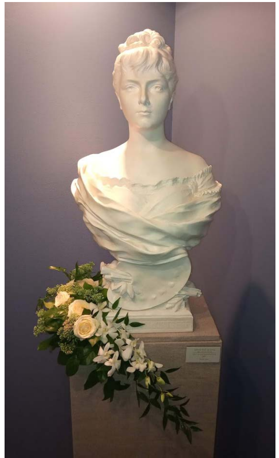
Бюст Марии Башкирцевой на выставке в Доме русского зарубежья. Сен-Марсо, 1895. Копия, Лувр

и, что самое главное, она разрушается. Долгое время соотечественники Башкирцевой пытались решить проблему, обращаясь в самые высокие организации, и сегодня этот вопрос находится на рассмотрении в Россотрудничестве. Возможно, в скором времени часовня будет включена в перечень мест погребения, которые находятся за рубежом и имеют для России историко-мемориальное значение.