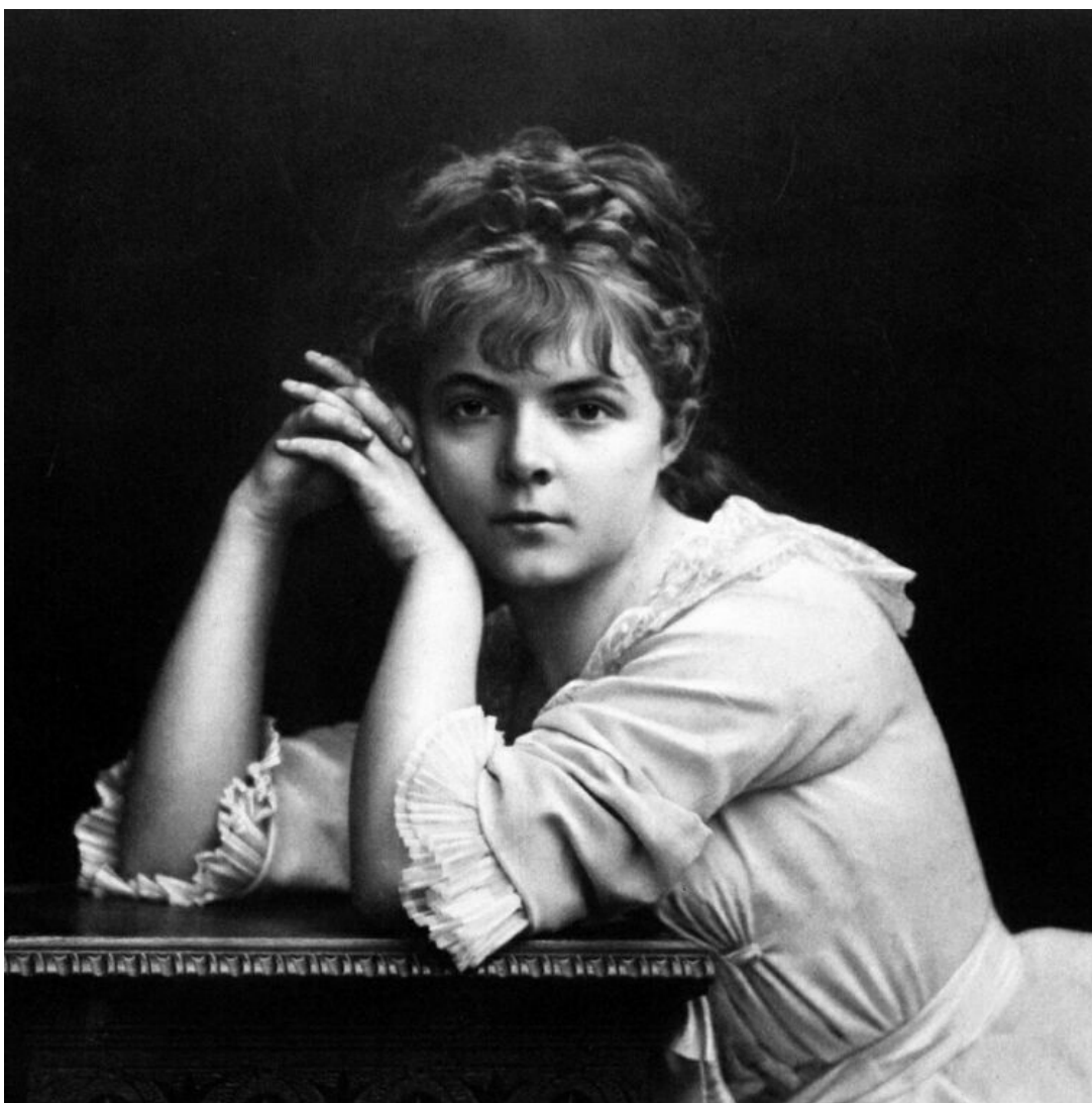
Мария Башкирцева.