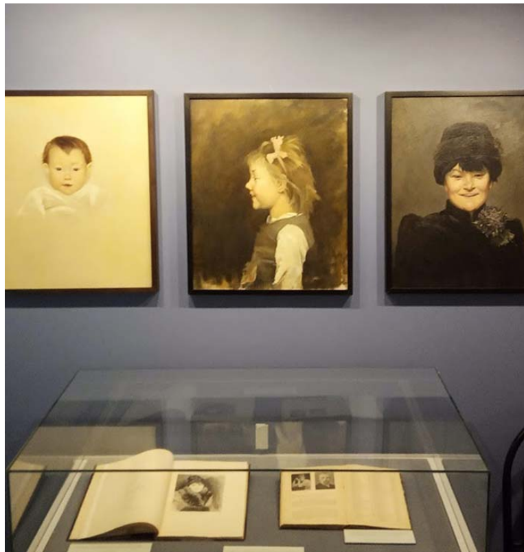
«Три улыбки» 1883. Триптих, копия, Русский музей. Фрагмент экспозиции