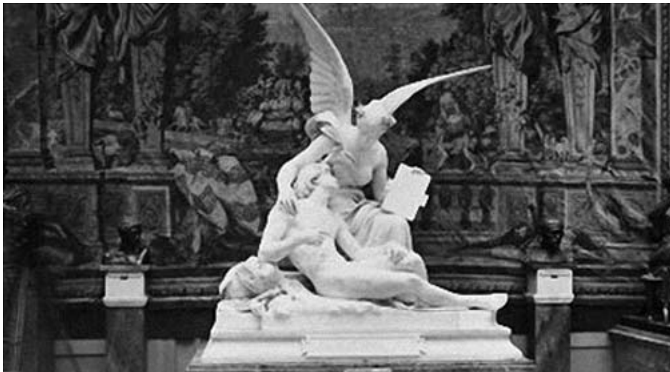
«Бессмертие». Скульптурная композиция. Люксембургский музей

В одном из залов Люксембургского музея в Париже находится мраморная композиция «Бессмертие» работы скульптора Лонжелье. Он выполнил ее по заказу французского правительства, вписав в сюжет крылатую фигуру ангела, у ног которого умирает молодой гений. В руках ангела свиток, где высечены имена безвременно покинувших этот мир выдающихся людей. Их восемь, и среди них лишь одно русское — Мария Башкирцева.