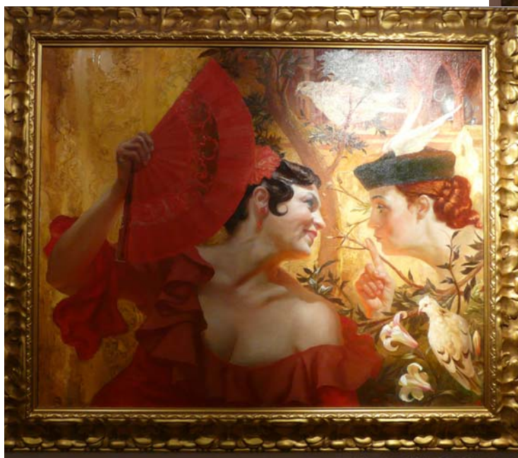
Портрет актрисы Анне Рееманн