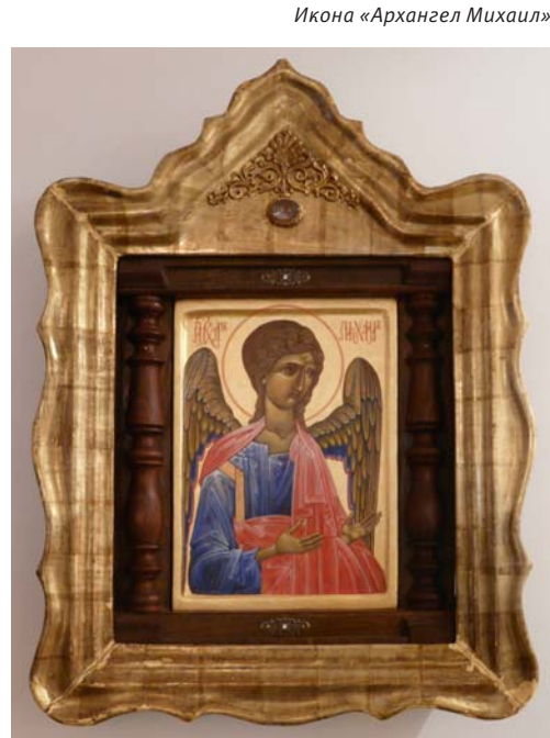
Икона «Архангел Михаил»