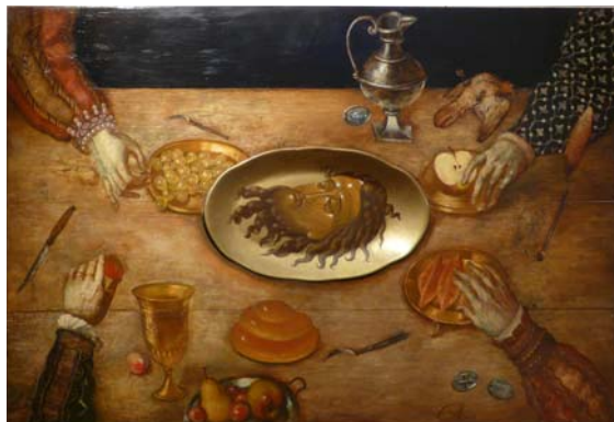
«Голова Иоанна Предтечи»