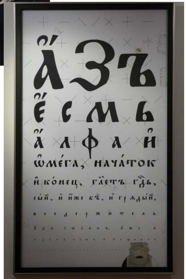
«Аз есмь Альфа и Омега»

актера. Я стараюсь вкладывать в свою сценографию внутренние глубокие концептуальные смыслы, и не важно, если они не читаемы. Важно, что это создаст правильное взаимодействие зрительного зала и сцены. Ведь какое самое ценное открытие в театре? То, что происходит внутри зрителя, когда у него появляется ощущение восторга от понимания происходящего на сцене. Моя задача — способствовать такому открытию. Порой этого можно добиться одной-единственной вещью, которая сработает на сцене сильнее, чем актеры».