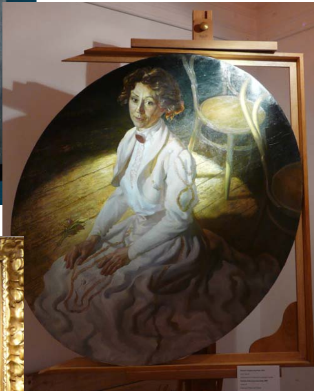
Портрет актрисы Ану Ламп