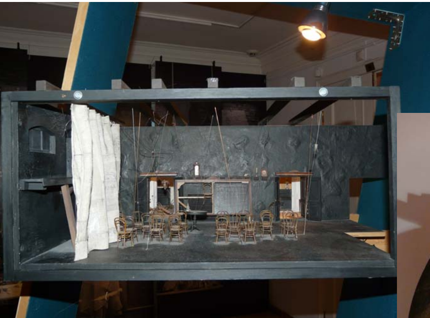
«Пианола» (реж. Э. Нюганен)